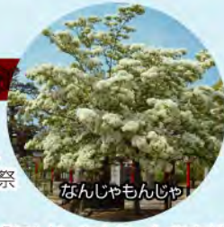
なんじゃもんじゃ

城山公園は芦屋の町並みを、魚見公園は響灘を一望できる公園です。いずれも桜とツツジの名所となっています。