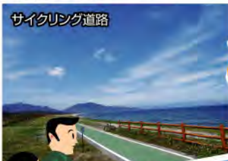
サイクリング道路