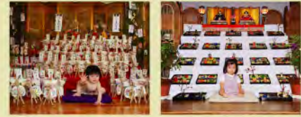
わら馬(男の子) 団子雛(女の子)

芦屋町には、長男が生まれ、初めて八朔の節句(旧暦八月一日…今は九月一日)を迎える家が、その子の成長を祈ってわら馬を作り飾る行事があります。女の子の場合は、米粉で作ったダゴビーナ(団子雛)を飾ります。