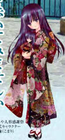
あしや人形感謝祭 公式キャラクター 恋鞠(こまり)

縄文の昔から時を刻み、歴史と自然が息づく町「あしや」。太陽の光とやわらかな風に包まれたこの町は、今でも伝統を受け継ぎ、訪れる人々を魅了し続けています。 雄大な自然と太古の歴史を肌で感じながら、ゆつくり芦屋を歩いてみませんか？