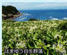
はまゆう自生群落